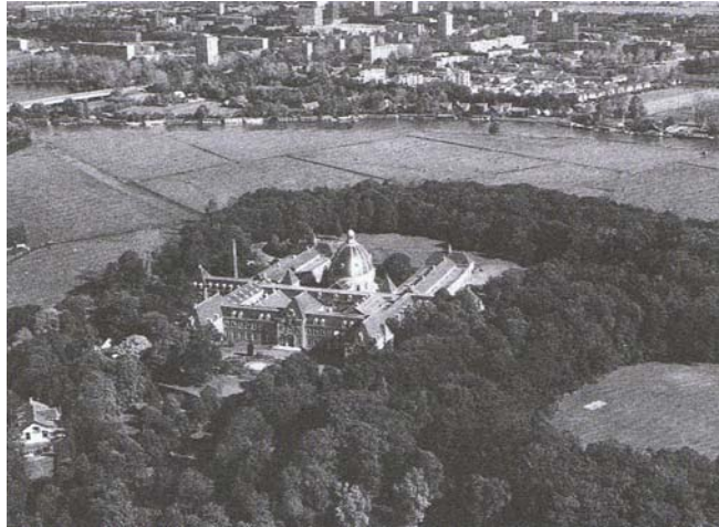
Het landgoed Hageveld