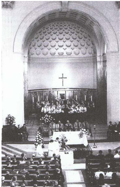
Mis in de Kapel bij het 150-jarig bestaan in 1967